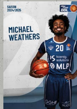
Guard | 🇺🇸