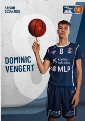
Guard | 🇩🇪