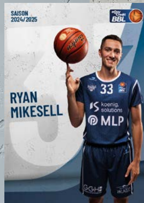
Forward | 🇺🇸