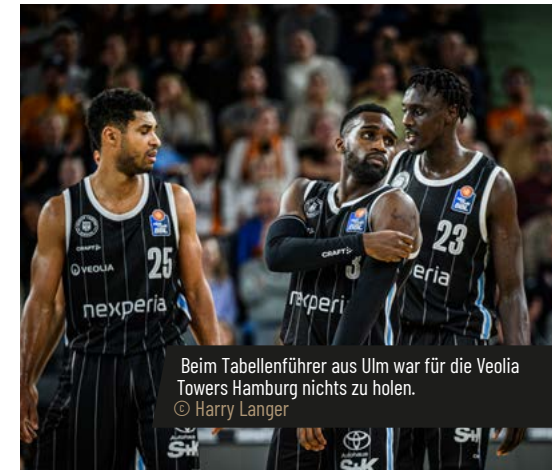
Beim Tabellenführer aus Ulm war für die Veolia Towers Hamburg nichts zu holen.

Die beiden Liga-Siege gegen Oldenburg und Ulm, sowie die denkbar knappe 80:81 Niederlage in München haben mitunter durchblicken lassen, wie gefährlich das Team von Headcoach Benka Barloschky werden kann. Dennoch stehen in dieser Spielzeit erst die beiden angesprochenen Siege aus insgesamt sechs Ligaspielen auf dem Papier und auch im BKT EuroCup können die Hanseaten erst einen Sieg aus den ersten sieben Partien verbuchen. Die Doppelbelastung durch den europäischen Wettbewerb scheint den Hamburgern zum Saisonauftakt demnach nicht ganz so gut gelegen zu kommen.