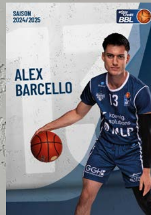
Guard | 🇺🇸