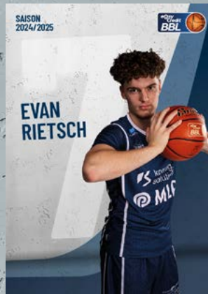
Forward | 🇫🇷