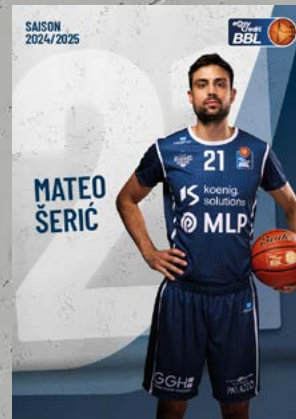
Forward | 🇩🇪