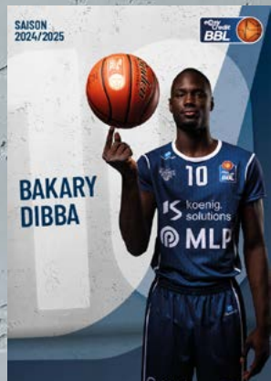
Forward | 🇩🇰