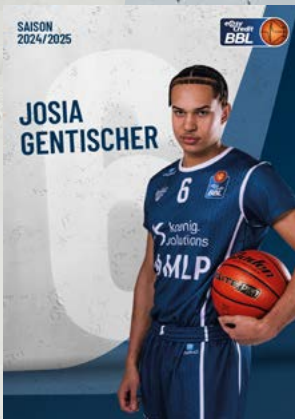
Guard | 🇩🇪