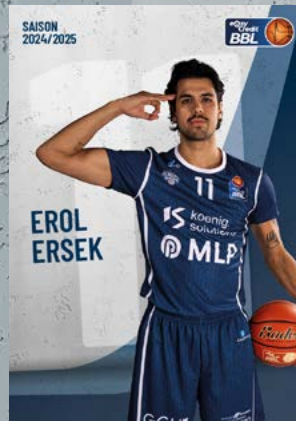
Guard | 🇩🇪 🇭🇺