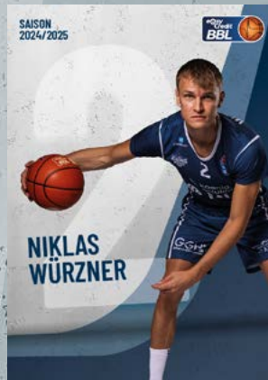
Forward | 🇩🇪