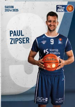
Forward | 🇩🇪