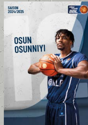
Center | 🇺🇸