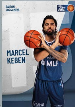
Center | 🇩🇪