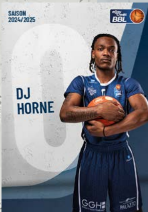
Guard | 🇺🇸